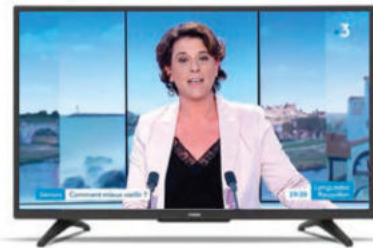
La revue de presse de l'édition 2019 est consultable sur le site interne du salon.