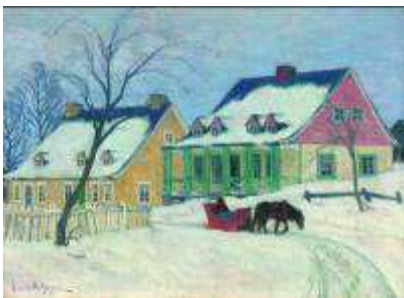
GAGNON Maxence, Old Houses, Baie-Saint-Paul, 1912