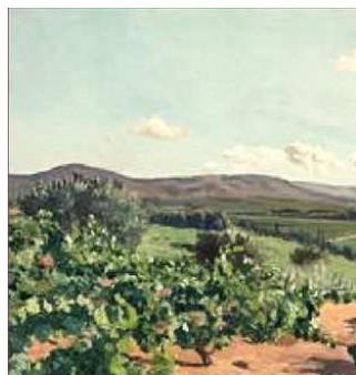
BAZILLE Frédéric Etude pour une vendange, 1868